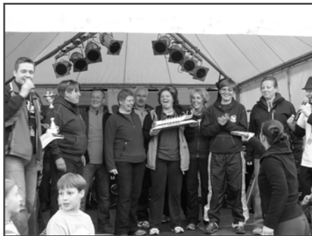
Sieger: Spree Sisters