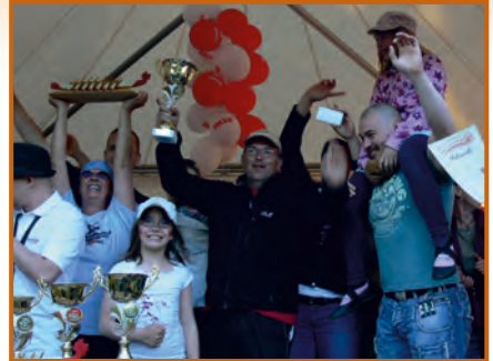
Sieger: The fast Dragons