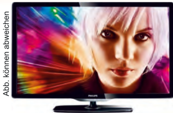
Abb. können abweichen