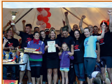
Sieger: Chorknaben Neue Mühle